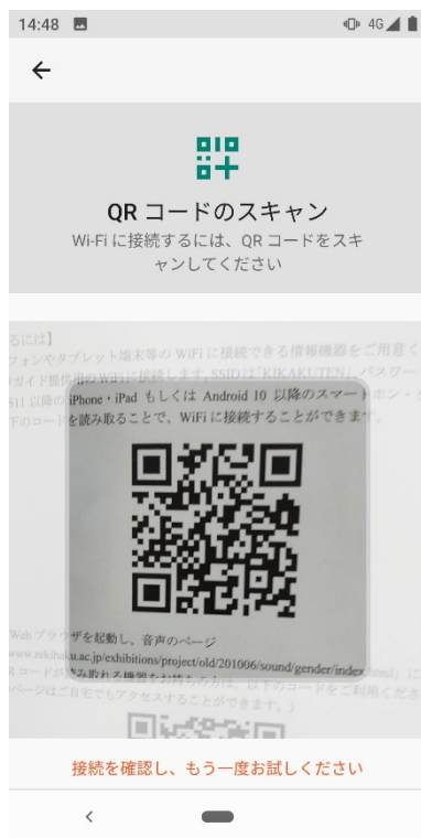
(5) QR コードを読み取る