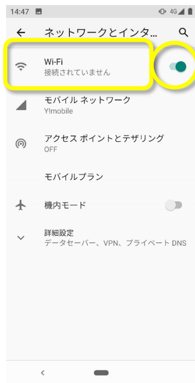
(3) 「Wi-Fi」を選ぶ (スイッチが Off のときは On にする)