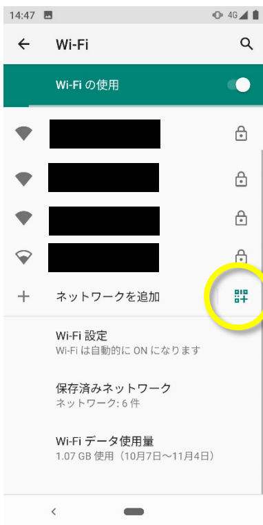
(4) 「ネットワークを追加」の右横のアイコンを選ぶ