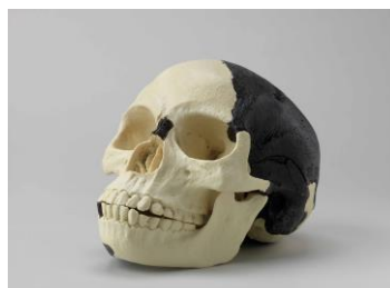
⑧. ピルトダウン人(偽化石)