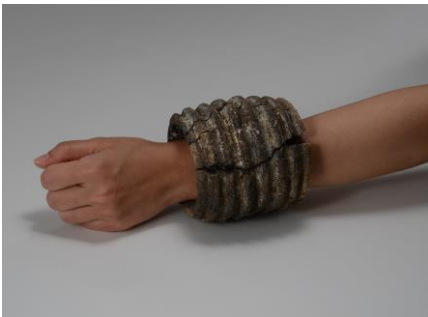
④. 荻ノ平遺跡腕飾り