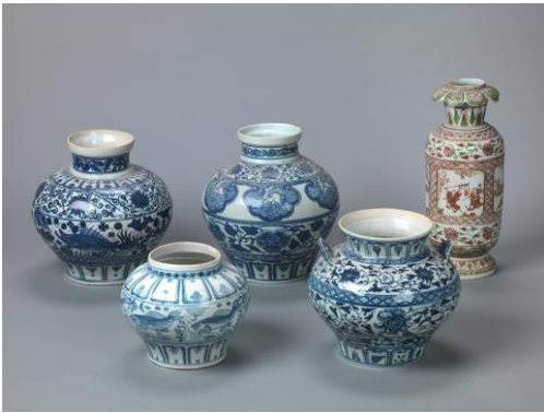
①. ニセモノの安南陶器