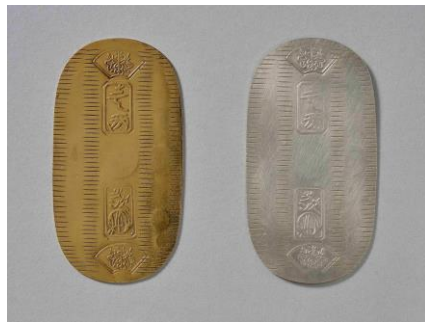
⑤. 色付け前後の復元小判