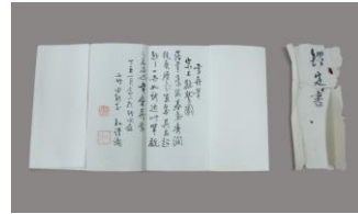
②. 伝雪舟「鷹之絵」掛軸と鑑定書