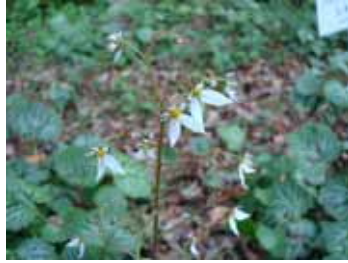
ユキノシタ(ユキノシタ科)