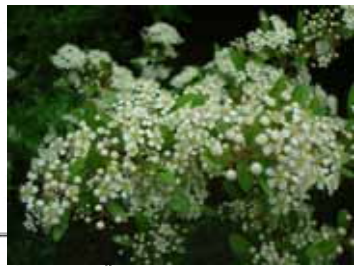
トキワサンザシ(バラ科)