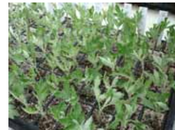
伝統の古典菊(準備中)