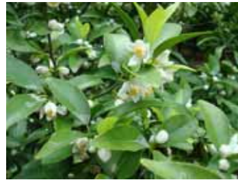
タチバナ(ミカン科)