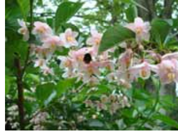
ベニバナエゴノキ(エゴノキ科)