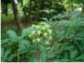
ヒメウコギ(ウコギ科)