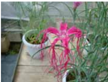
伊勢ナデシコ(ナデシコ科)