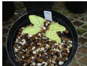
伝統の朝顔(準備中)