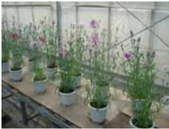
伊勢ナデシコ(展示風景)