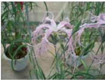
伊勢ナデシコ(ナデシコ科)