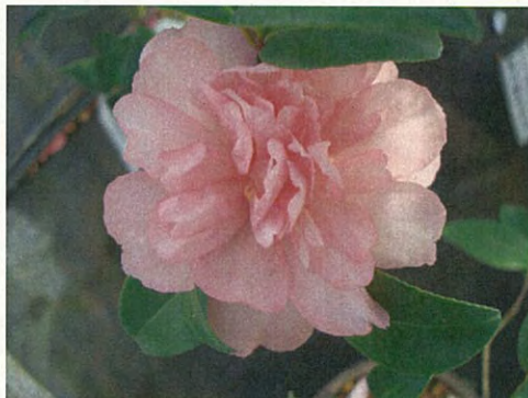
コットン・キャンディ アメリカ生まれ、綿あめの意味です。