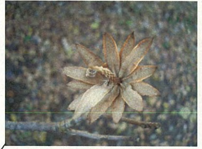
ユリノキ(果実) (モクレン科ユリノキ属)