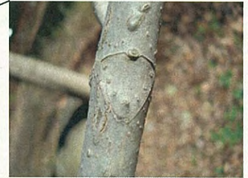
トチノキ葉痕 (トチノキ科トチノキ属)