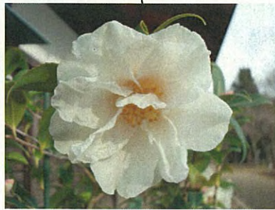
銀竜(ハルサザンカ群)