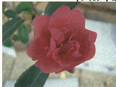
唐衣(ハルサザンカ群)