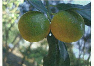
キンカン(ミカン科キンカン属)