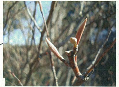
クロモジ(クスノキ科クロモジ属)