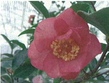
色も香も (サザンカ群)