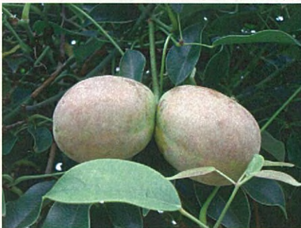
ムベ(アケビ科ムベ属)