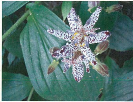
ホトギス(ユリ科ホトギス属)