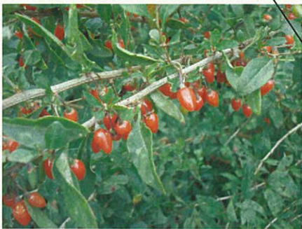
クコ(ナス科クコ属)