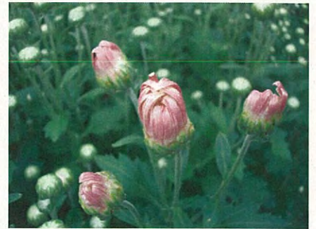
モッテノホカ 食用菊 (キク科キク属)