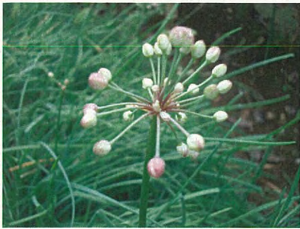
ラッキョウ(ユリ科ネギ属)