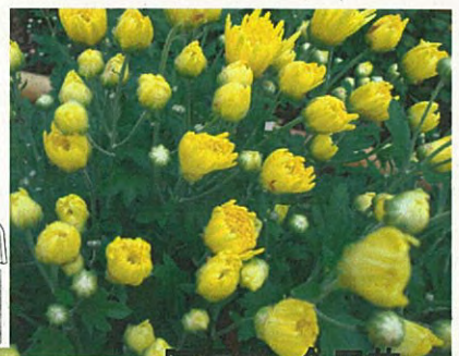
阿房宮 食用菊 (キク科キク属)