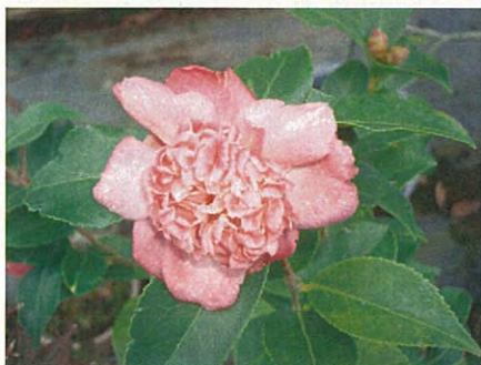
丁子草 (サザンカ群) (ツバキ科ツバキ属)