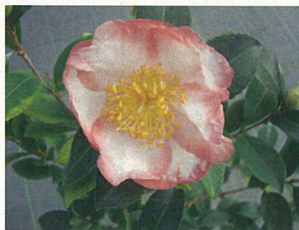
初鏡 (サザンカ群) (ツバキ科ツバキ属)