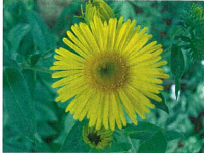
オグルマ(キク科オグルマ属)