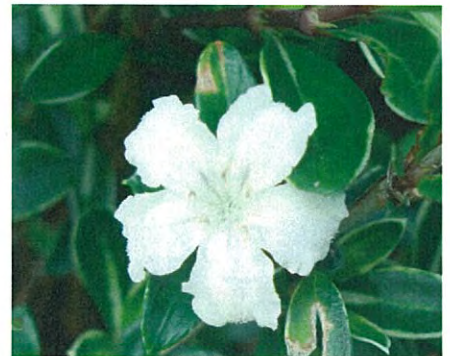
ハクチョウゲ(アカネ科ハクチョウゲ属)