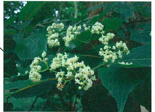
ケンポナシ(クロウメモドキ科ケンポナシ属)