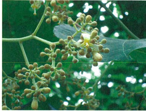
アオギリ(アオギリ科アオギリ属)