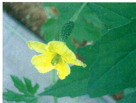
ツルレイシ(ウリ科ツルレイシ属)