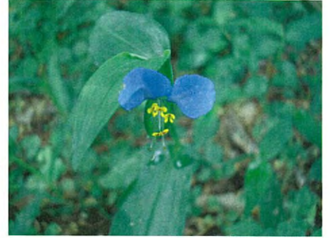
ツクサ(ツクサ科ツクサ属)