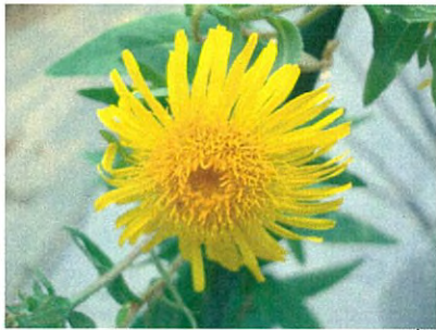
サクラオグルマ (自生していたサクラオグルマ の株分けをいただきました)