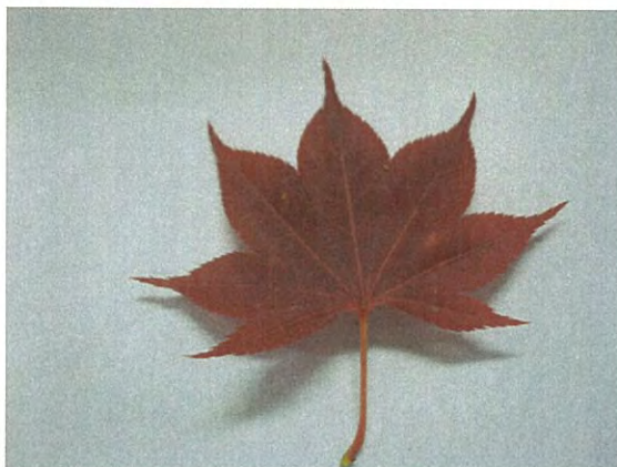
七変化(しちへんげ) オオモミジ系で葉は赤茶