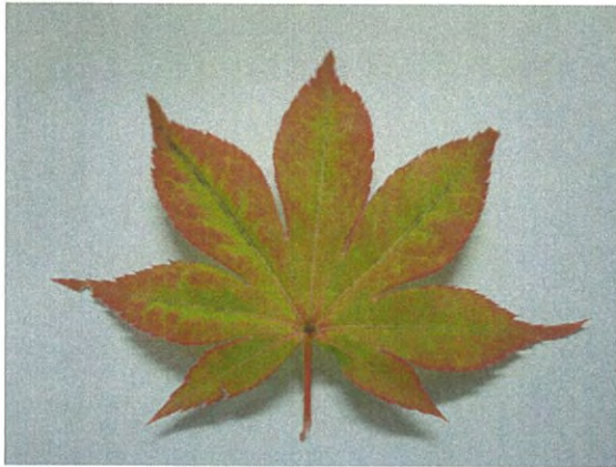
浜乙女(はまおとめ) オオモミジ系で葉は黄緑