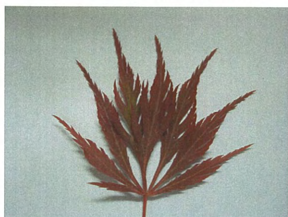
稲葉枝垂(いなばしだれ) ヤマモミジ系の葉が赤茶の枝垂