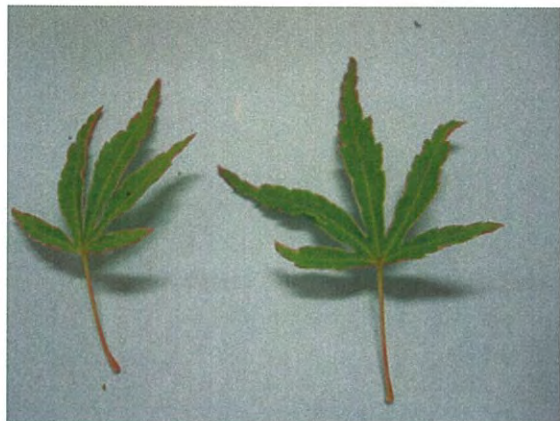
天女の星(てんによのほし) イロハモミジ系薄茶覆輪がある