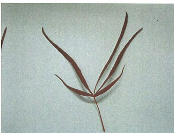
銀糸(ぎんし) オオモミジ系の葉が細糸葉