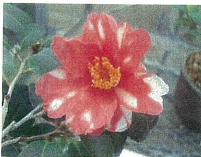
“蜀紅錦”日渉園茶梅譜にでています。