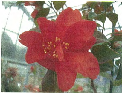
“讚岐”で平開咲、小輪。

ハルサザンカ群が満開です。展示期間は終わっていますが、ハルサザンカ群が咲いています。鮮やかな紅色や、紅の中に白い斑がはいつています。