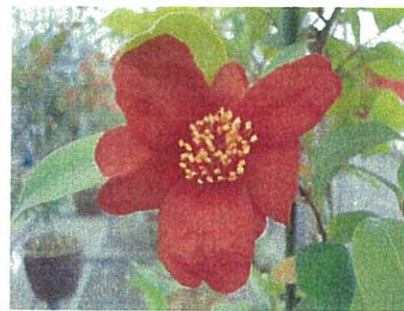
“竜光”1972年に発見された。