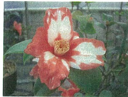
“鎌倉絞”ラッパ咲、江戸時代の椿図譜にでています。