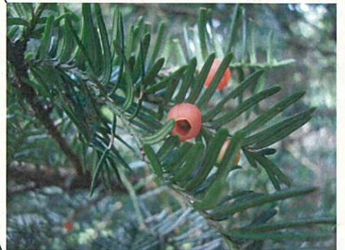
イチイ(イチイ科イチイ属)