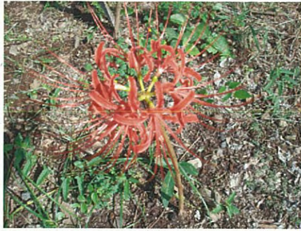
ヒガンバナ(ヒガンバナ科ヒガンバナ属)