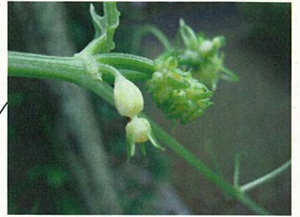
ハヤトウリ(ウリ科ハヤトウリ属)