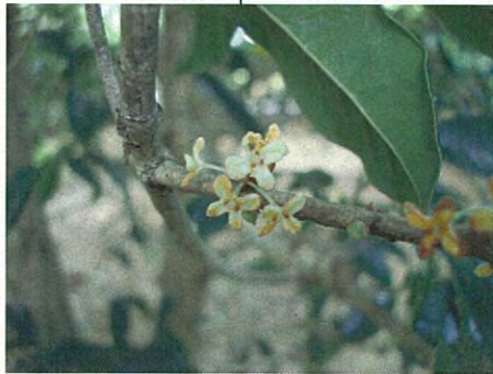
ギンモクセイ(モクセイ科モクセイ属)