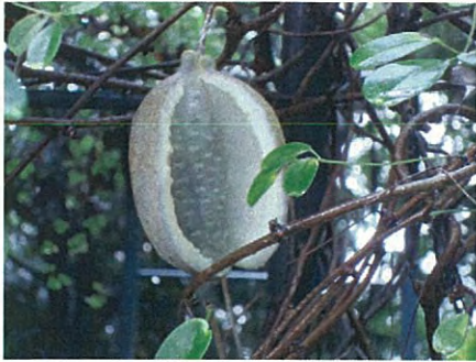
アケビ(アケビ科アケビ属)