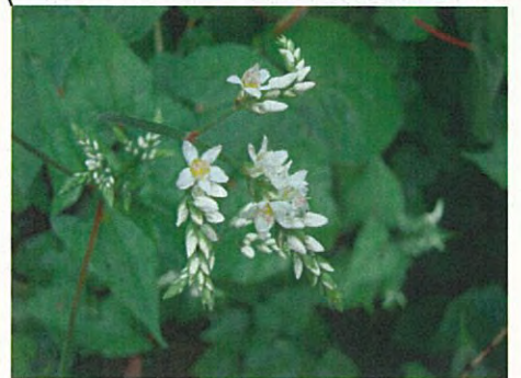
シャクチリソバ(タデ科ソバ属)