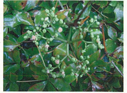
ヤブガラシ(ブドウ科ヤブガラシ属)