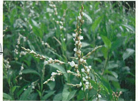
アイ(タデ科タデ属)