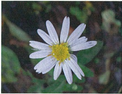
ヨメナ(キク科ヨメナ属)