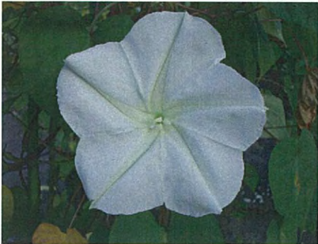
ヨルガオ(ヒルガオ科サツマイモ属)