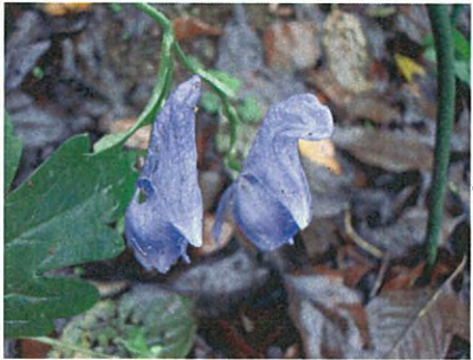
ヤマトリカブト(キンポウゲ科トリカブト属)