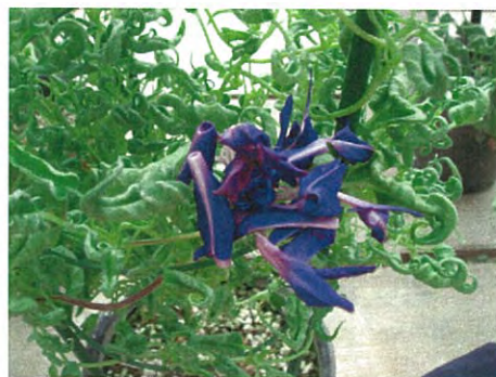
419 燕風鈴獅子咲牡丹