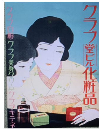
「クラブ堂ビル化粧品」ポスター

随着产业的发展和都市化的扩大，人们的生活发生了巨大的变化。大商场的诞生、化妆品的流行等等，新时代的消费和生活文化进入了人们的视野。为了迎合人们日益增长的新型消费的需要，大量女性开始进入职场。