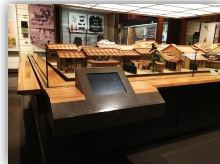
京都街景复原模型