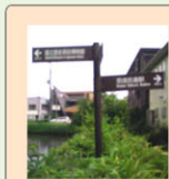
案内板 (茶色と緑色の ものがあります)