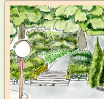
橋を渡って 下さい