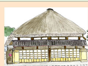
茅葺き屋根の民家