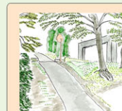
ゲート看板が 見えてきたら その先は長い 坂道となります