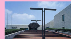
国立歴史民俗 博物館