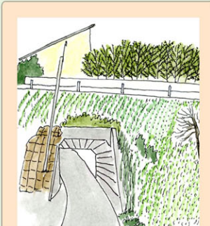
トンネルは道が 狭いので車などに 気をつけて下さい